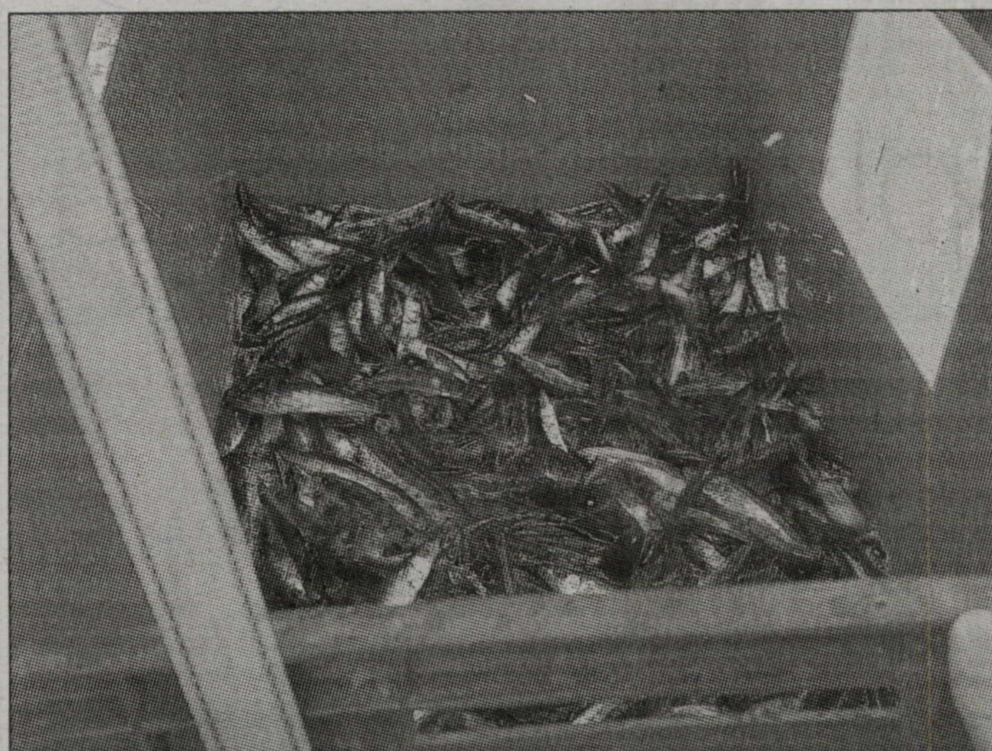
ZANDARTU MAZUĻI. To vidējais svars ir 6,4 gram.

Ielaižamo zivju daudzumu aprēķina pēc ūdenstilpes platības, to piemērojot konkrētai sugai. Pakuļu ūdenskrātuvē maksimālais rekomendētais ielaižamo zandartu skaits — 15 000. Saldus ezerā daudzumu noteica pēc senāk veiktas izpētes. Ezers krietni mazāks par Pakuli, tāpēc arī zandartu mazuļu skaits desmit reizi mazāks.